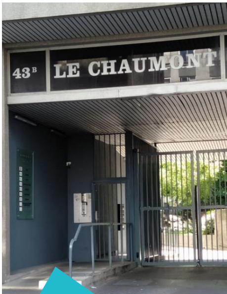
Empruntez le passage piéton (accessible PMR)

Nos locaux se trouvent au 2ème étage de l'immeuble situé dans la cour de l'immeuble « Le Chaumont »